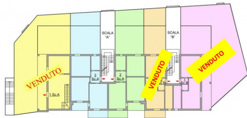
Planimetria Piano Terra Casa "Mattia" (A)

TUTTE LE MISURE SIA GRAFICHE CHE ANALITICHE SONO INDICATIVE E NON IMPEGNATIVE. LA SOCIETÀ SI RISERVA INOLTRE, A SUO INSINDACABILE GIUDIZIO, DI APPORTARE QUALSIASI MODIFICA RITENGA NECESSARIA.