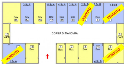
Planimetria Piano Interrato Casa "Mattia" (A)

TUTTE LE MISURE SIA GRAFICHE CHE ANALITICHE SONO INDICATIVE E NON IMPEGNATIVE. LA SOCIETÀ SI RISERVA INOLTRE, A SUO INSINDACABILE GIUDIZIO, DI APPORTARE QUALSIASI MODIFICA RITENGA NECESSARIA.